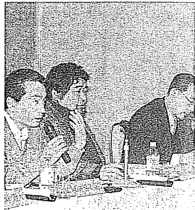
第22回豊島廃棄物処理協議会 述べる住民 一高

検討。昨年12月にあつた同委員会が技術面で承認を得ていた。県はさらに、島外に持ち出して水洗浄処理する「オフセット処理」を主張した。